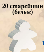
20 старейшин (белые)