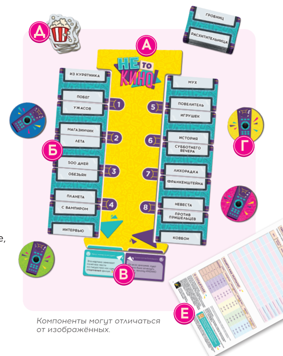
Компоненты могут отличаться от изображённых.